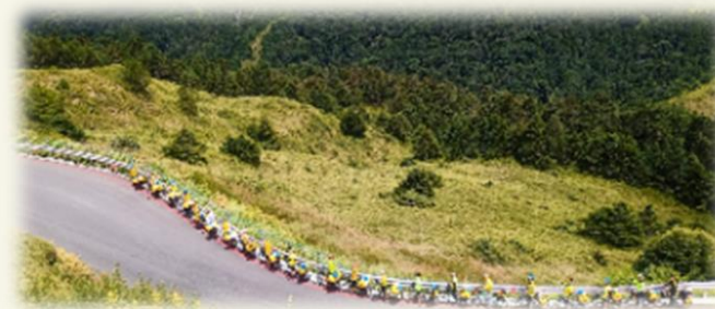
桃園市武陵高中單車環島課程