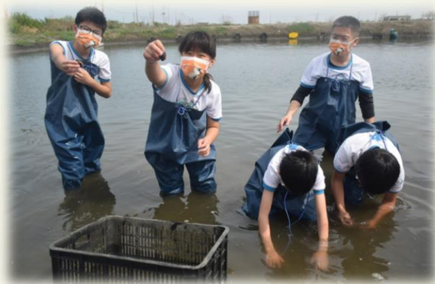
臺南市建功國小 養殖場摸文蛤體驗