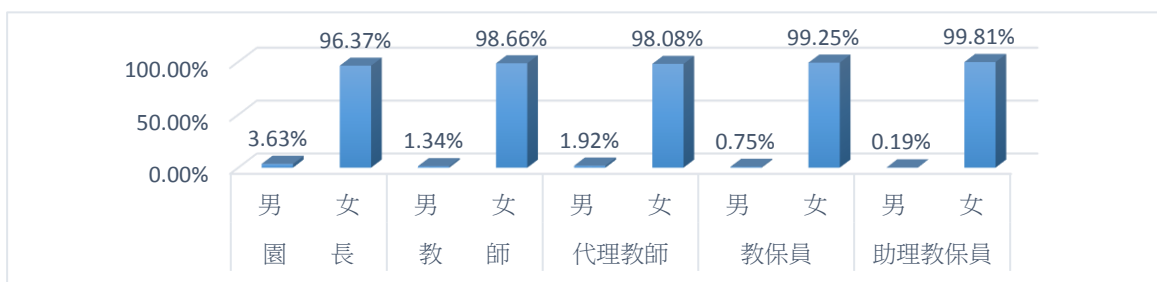
圖 1、105 學年度本市教保人員男、女比例

從教保服務人員性別觀察，105 學年度新北市幼兒園女性教保服務人員計 7,580 人，占全體教保服務人員(7,669 人)98.84%，其中女性園長 770 人(占園長數之 96.37%)，女性教師數 1,624 人(占教師數之 98.66%)，女性代理教師數 153 人(占代理教師之 98.08%)，女性教保員 4,500 人(占教保員之 99.25%)，女性助理教保員 533 人(占助理教保員 99.81%)。由以上資料可知，女性教保服務人員比率高達九成八以上，應與女性普遍較為細心及較具耐心的特質有關。(詳圖 1)