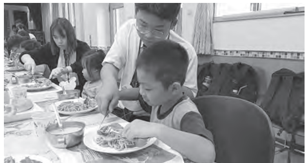
圖2 原汁原味的西餐禮儀體驗活動

今年暑假本校與新北市私立裕德雙語高級中學合作，配合該校「偏鄉服務學習活動實施計畫」，在永定國小進行為期三天的英語學習營活動（如圖1）。裕德高中高二與高三共29名學生，與教師共同規劃了各式各樣的學習活動，內容包括英語歌曲教唱、體育遊戲、手作體驗等等，透過活潑有趣的方式，讓本校一到六年級的孩子們，從一開始的生澀害羞，到最後能完整自信的展現自我，唱出一首首經典的英語歌曲；而西餐禮儀學習活動的安排，不僅僅是大哥哥大姊姊們一手策畫，除了將平時在學校所學的西餐禮儀原汁原味地設計在教學活動中（如圖2），用餐過程的帶位引導、解說示範與情境鋪排，都讓我們的孩子體驗到在西餐廳用餐時一樣的感受，營造一番特別的學習經驗，也接受到不一樣的文化洗禮。