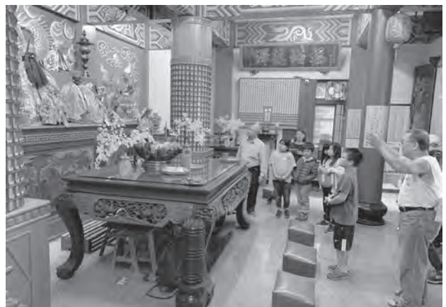
圖5 在地耆老介紹地方信仰

學校負有社區文化傳承的使命，而傳承文化的關鍵就在於將在地人的鄉土心緊密連結。偏鄉學校需要外來文化的刺激，但卻不能忘卻自身固有的優質文化。永定國小的老師深刻的體驗到我們的學生應該要能夠自然而然地說出家鄉的特色，並深化對鄉土的熱愛，所以我們邀請地方仕紳擔任講師（如圖5），透過戶外教育的形式進行在地踏查，以說故事的方式傳承在地文化的特色與價值，學生們藉由訪問的過程，詢問居住地過往今來的歷史脈絡（如圖6），不但加深對石碇地區文化的了解，也促進了不同世代在地情誼的認同感。