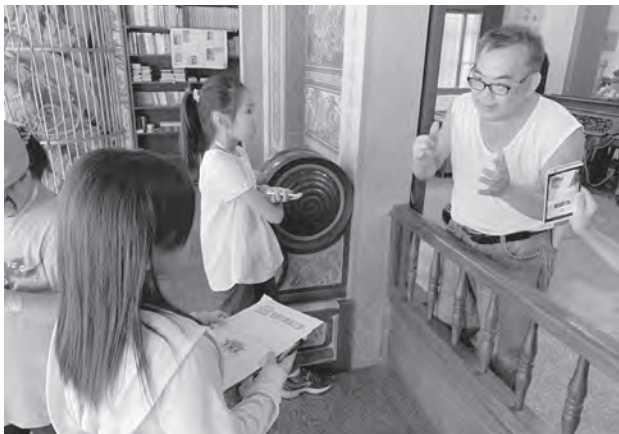
圖6 學童藉由訪問過程認識廟宇

的興衰娓娓道來，煞那間，老師們彷彿時光穿梭回到過去，奠定了我們都是永定人的情誼。