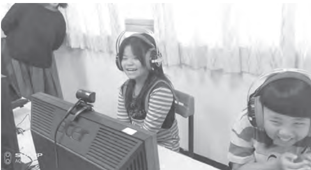
圖3 英語教育數位學伴活動

數位時代的來臨，翻轉了教室課堂的學習方式。我們與國際扶輪社、樸誠文教關懷協會及臺北民樂扶輪社合作，克服了偏鄉學校在地域上的不便，藉由線上學習、交流與互動的方式，進行線上英語學習與STEM課程。