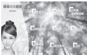
圖3 手機APP眼疾AR體驗操作介面