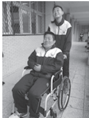
圖9 老人行動輔具輪椅體驗