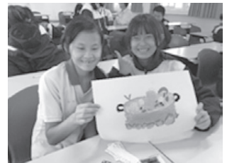
圖11 暖心湯創意發想