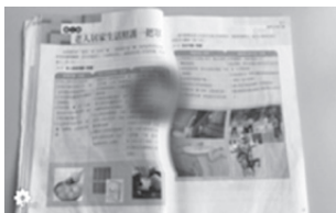
圖5 手機APP黃斑部病變AR體驗