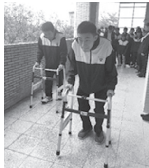
圖7 老人行動輔具助行器體驗

正確使用方法（圖6）。原本擔心學生害羞不好意思示範體驗，令人驚喜的是這些孩子能透過課程情境引導，自信而勇敢地表示願意體驗示範，讓人感動的是，示範期間有一位席間學生自動地在旁說明與指導應該如何包尿布會比較舒適，詢問原因，原來其母親是保母，所以熟悉寶寶包尿布的技能，類推到成人包尿布，沒錯！這就是一種素養的展