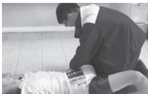
圖6 老人身體照顧包尿布體驗

正確使用方法（圖6）。原本擔心學生害羞不好意思示範體驗，令人驚喜的是這些孩子能透過課程情境引導，自信而勇敢地表示願意體驗示範，讓人感動的是，示範期間有一位席間學生自動地在旁說明與指導應該如何包尿布會比較舒適，詢問原因，原來其母親是保母，所以熟悉寶寶包尿布的技能，類推到成人包尿布，沒錯！這就是一種素養的展