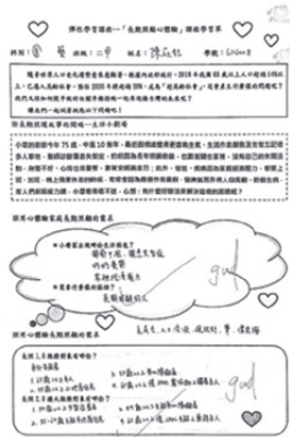
圖13 長期照顧心體驗學習單