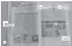
圖4 手機APP白內障AR體驗