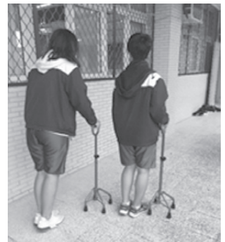
圖8 老人行動輔具拐杖體驗