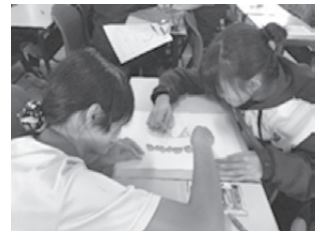
圖10 暖心湯創意發想