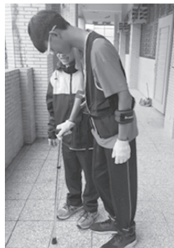
圖2 老人身體限制體驗學習

徵求自願上台示範需要尿布輔助的爺爺與協助使用紙尿布的孫子，學習體驗被包尿布的感受及成人紙尿布的