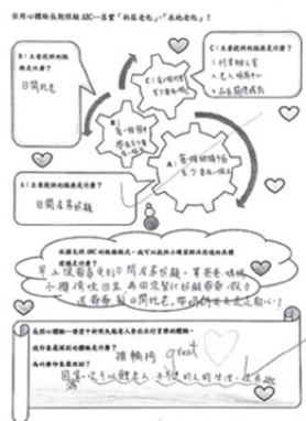
圖14 長期照顧心體驗學習單