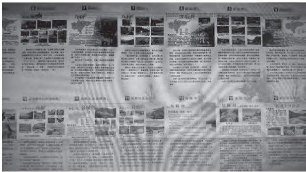
設計瑞芳山河海社區綠活圖 提供社區及教師運用校訂課程教材

四、針對六小時的彈性課程時數，以I-STEAM跨領域融合國際課程設計理念規劃；另因有體育班更成立體發會開發專訓課程素養設計；兩類都積極融入議題教育，未來擬進化為I-STREAM彈性課程設計，讓各領域更跨界。持續進行中！