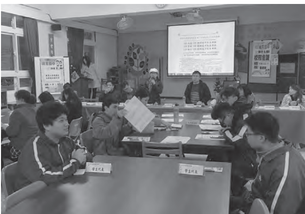
校務會議親師生同在共商校務

瑞中深知上述的事實，學校行政、教師會、家長會、校友會、志工大隊、退休人員聯誼會、社區機構與企業，還有政府的資源，皆都要全心全力的投入。瑞中只能成功，瑞芳學子務必精質，鄉土又國際，學術又藝才，經過多次逐年的集結共識，統整在地文化特質，瑞芳的在地風土民情的特色，瑞芳在地發展的重點與期待，調整了中長程校務計畫的課程發展願景—人文活力、動靜皆宜、樂學能和、國際競合。校親師生在校務會議達成共識，我們要踏步走了！