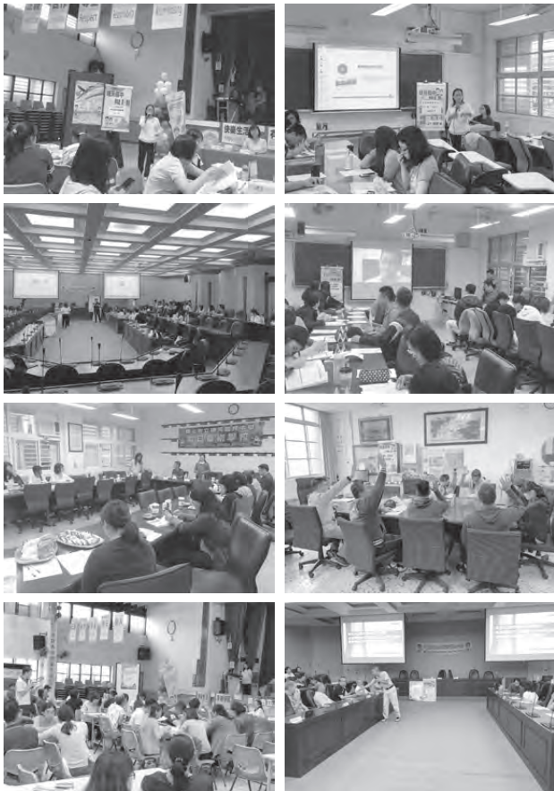
透過會議及校外參訪集體共修共備 精進專業知能及產出課程

領域會議、領召會議、課發會、特推會、體發會、核心工作小組會議、專任導師會議、行政會議與主管會議、以及備課日，都是學校成員進修與宣導討論課程或研習精進的機會，學校需珍惜也感謝師長們的奉獻！