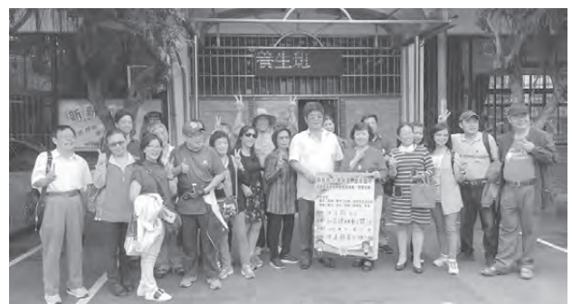
親師與社區發展協會參訪新店社區總體營造

例如；申請106-108專業成長學校計畫—瑞中教師師師有社群；參與衛福部瑞芳區社區旗艦計畫—參訪新店下城社區總體營造；申請新課綱