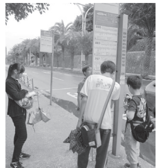
圖9 學生查找可由紅毛城回淡水捷運站的公車

(五)全班出遊自律規範的實踐：本次校外教學全由學生自主規劃與執行，教師僅在旁邊做紀錄與必要的提醒。出門前一天負責成員向學生做外出叮嚀，當天早上向學生收取保險費9元，在每一車站與景點控管學生秩序並邀訪講師以進行解說，讓同學能在學習與輕鬆的氣氛中進行校外教學中自律學習。