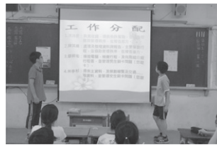
圖4 小組學生上臺報告

(三)小組報告：獲勝小組的計畫案將作為全班實際校外教學之內容，且該小組可於週三下午由導師帶領進行實際場勘，且費用全數由導師負責，因此，學生求勝意願頗高，又為增加比賽的公平性，當天（106年5月19日）委由六位教師擔任評審，分數占比百分之六十，學生小組