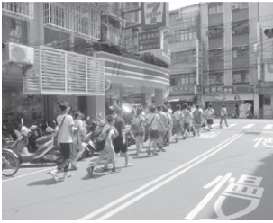
圖10 小組成員於路隊前後維持班級行進秩序