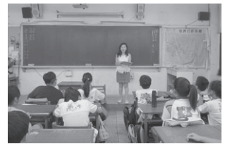
圖5 教師與學生分享評審心得