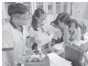
圖3 運用網路硬碟備份與傳輸資料（溝通互動：科技資訊與媒體素養）

(三)小組報告：獲勝小組的計畫案將作為全班實際校外教學之內容，且該小組可於週三下午由導師帶領進行實際場勘，且費用全數由導師負責，因此，學生求勝意願頗高，又為增加比賽的公平性，當天（106年5月19日）委由六位教師擔任評審，分數占比百分之六十，學生小組