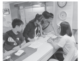
圖7 學生與紅樹林生態教育館接洽導覽時間