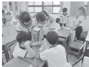
圖1 以課間活動或早自習進行小組討論（社會參與：人際關係與團隊合作）

(二)小組討論、查詢相關資訊，並撰述正式報告：報告格式與要件大致上與寒假作業相同，但若要讓評審委員或其他組別能有更多的認同，得以其他系統性思考法來做綜合報告。