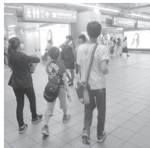
圖6 試走捷運路線板橋到紅樹林車站並詳記費用

(四)小組場勘：最後本班由第六組淡水一日遊獲勝，筆者利用週三（106年5月24日）下午無課務時間實地帶學生外出場勘，其目的在於讓學生瞭解交通動線、時間花費、場館人員預約導覽時間，以及核對詳細經費開支（以下圖說均達到核心素養裡的系統思考與解決問題）。