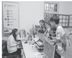
圖8 學生與紅毛城館方人員接洽導覽時間