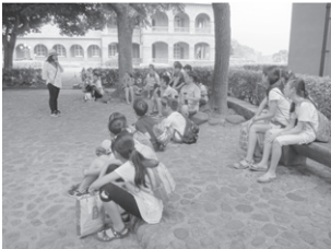
圖12 於紅毛城學生專心聆聽館方人員的解說 (社會參與：多元文化與國際理解)