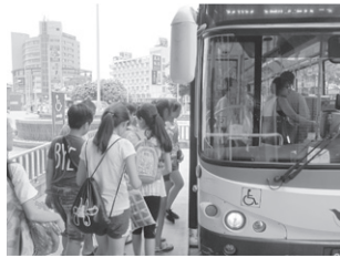
圖11 小組成員指示學生搭乘正確的公車班次