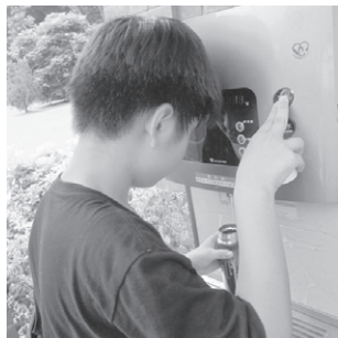
圖13 攜帶環保杯裝水已成為學生外出的習慣 (社會參與：道德實踐與公民意識)

(六)理財教育於生活中的具體落實：學生於出發前需針對第六組學生所擬定的計畫，規劃屬於自己的預算表，並於過程中記帳，以核算自己原先預計與實際間花費間的落差，由於學生在出門前已針對行程擬出可能的花費，那麼出門後在理性的箝制下，較不會有過於衝動的消費行為，如下圖S18學生，考量當天天氣熱，因此，在出門前編列飲料20元，消費選擇為需要，理由是口渴，而冰淇淋45元，消費選擇是想要，理由是想吃，兩者合計65元；出門後實際消費飲料33元、冰25元，合計金額為58元並未超過原來的預算，但在飲料的消費選擇上卻調整為想要，主因在於淡水捷運站有提供飲水機可以裝水，但她仍選擇購買飲料。