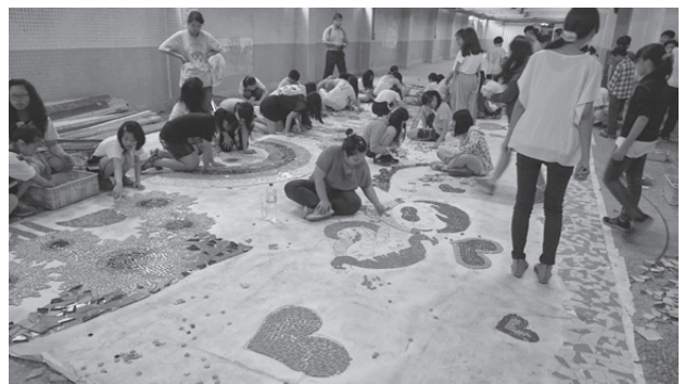
畢業集體藝術創作讓每個學生都能參與