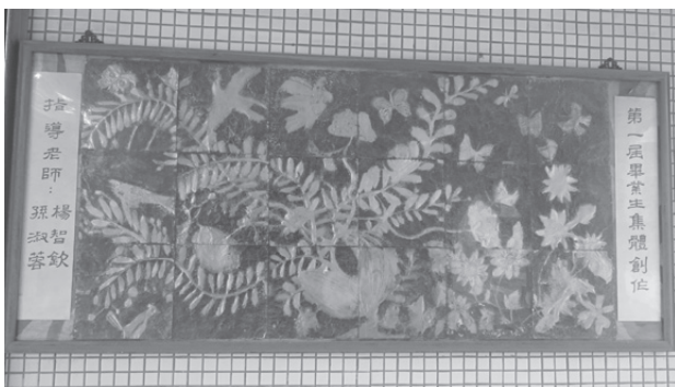
第一屆畢業生集體創作

檢視本校二十幾年來的畢業創作歷程，其中的創作內容、材質、形式及發想，隨著時間的更迭，也一直在演變，在一棒接一棒的教育傳承中，每個老師都有不同的創意及理念，充實了每個創作的內涵及面向，但不變的是在每次的創作中把美感教育融合在學習環境的堅持，以及學生在參與過程中的各種感動。