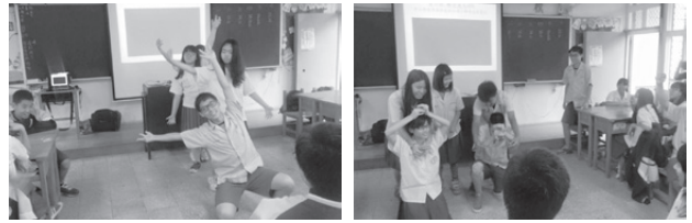
展覽會—反彈琵琶 導覽員解說—新款式抱笙