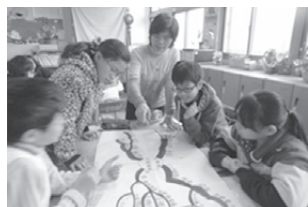
小組繪製心智圖統整國語課文重點