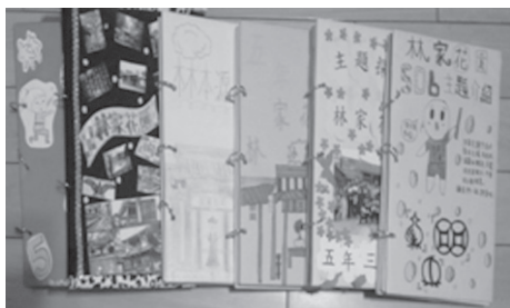
6個班的《林家花園主題報告》學生作品