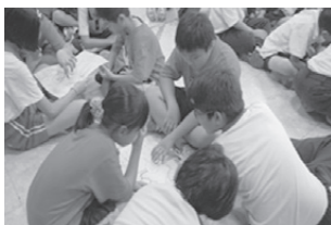
小組看心智圖說故事

本屆學生上過心智繪圖有先備經驗（林秀雲，2013），首先為學生複習心智繪圖法，俾利後續討論學習用。其次編製「專題研習六步法學習單」幫助師生了解主題學習的方向與步驟。