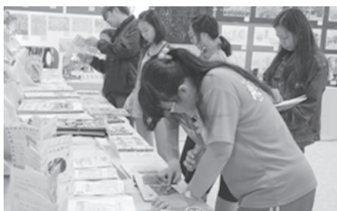
校慶藝文展學生與家長欣賞《林家花園主題報告》