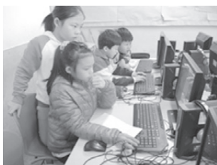
學生研究瀏覽的資料利用資料繪製個人心智圖

資訊老師依圖書教師提供的線上網站，首先，帶領學生進行有意義的線上學習，避免學生漫遊其他網站；其次，指導學生如何聚焦網站搜尋，如子題是「漏窗」，在瀏覽資料時只要談到「漏窗」的文章，都要瀏覽一下，可能是自己需要的資訊，就複製貼在