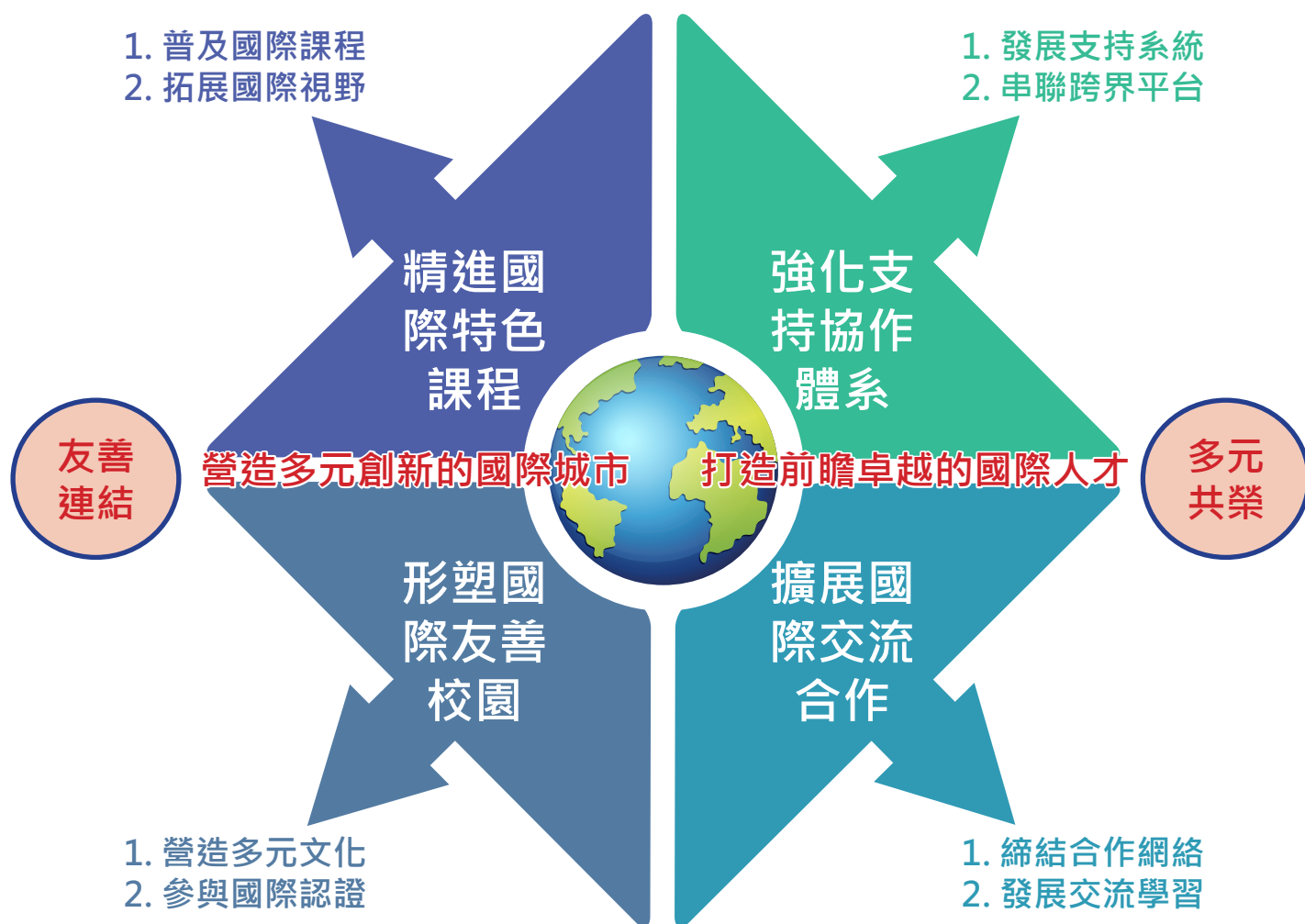
圖 1 新北市國際教育白皮書整體關係圖

白皮書著力於：國際教育與雙語課程的普及、學校國際化的多元發展與認證、國際教育專業支持體系的健全，以及國際交流的區域團隊建構。依此方向凝聚出願景及核心理念，並發展出 4 大主軸：「精進國際特色課程」、「形塑國際友善校園」、「強化支持協作體系」及「擴展國際交流合作」；在主軸下將目標設定為：「普及國際課程、拓展國際視野；營造多元文化、參與國際認證；發展支持系統、串聯跨界平台；締結合作網絡、發展交流學習」。整體關係如下圖所示：