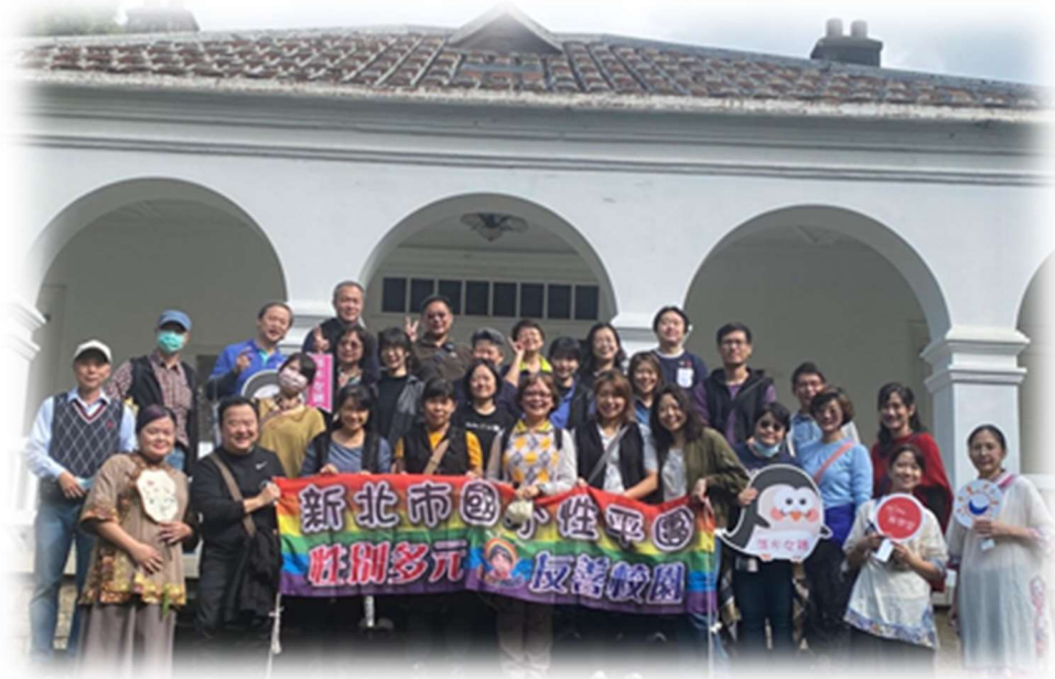
說明：國中小性平輔導團前往淡水進行實地踏查

(三)發展課程教材教案：研發性別平等教育教案：居住地方的故事-向著夢想前進的女孩。嘗試將性別平等議題的融入社會領域，學生於戶外教育到淡水可以看到馬偕頭像、淡水女學堂，就想到第一女醫師-蔡阿信的故事，在科學、醫學的領域能提供孩子多元的參考文本，並了解主角的故事或努力與貢獻，希冀能打破職業之性別刻板印象。