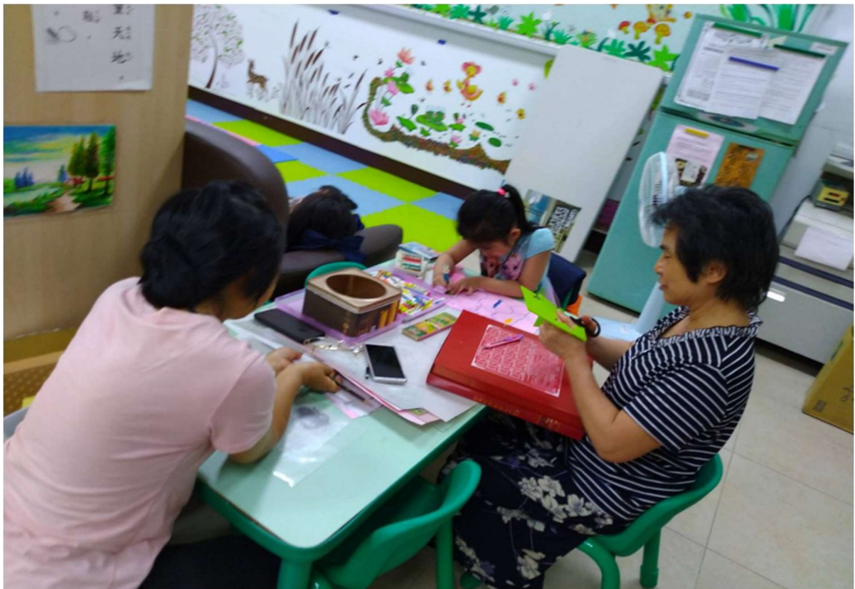
文山國中 托育人員與新住民子女做手工及畫畫