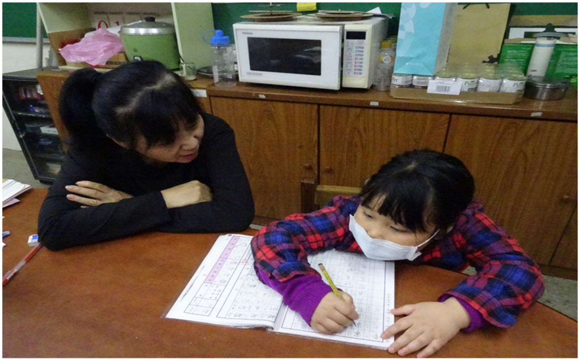
林口國中 托育人員輔導新住民子女課業