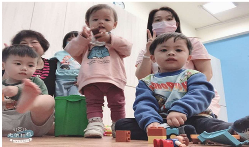
新埔國小 托育人員與新住民子女大合照