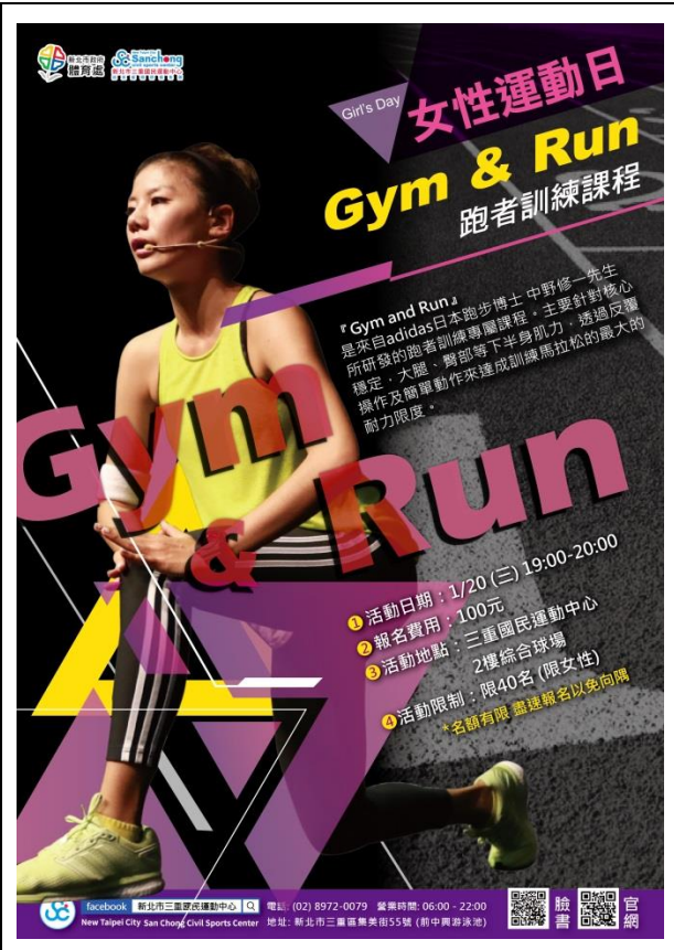
三重國民運動中心-女性運動日課程宣傳海報