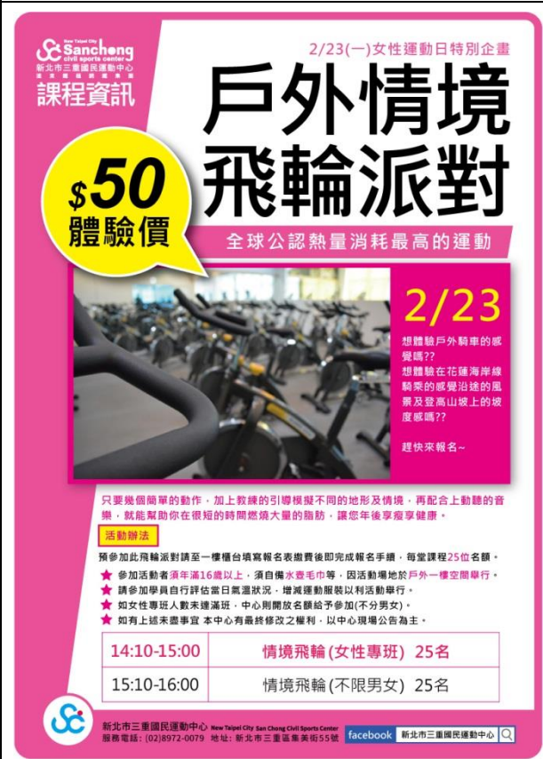
三重國民運動中心-女性運動-戶外飛輪