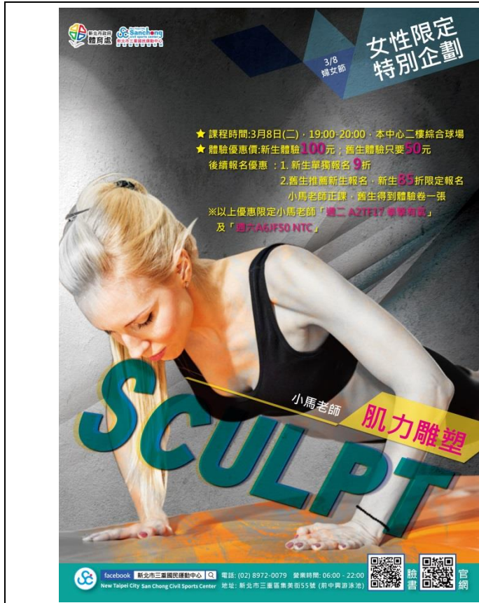
三重國民運動中心-38 婦女節課程宣傳海報