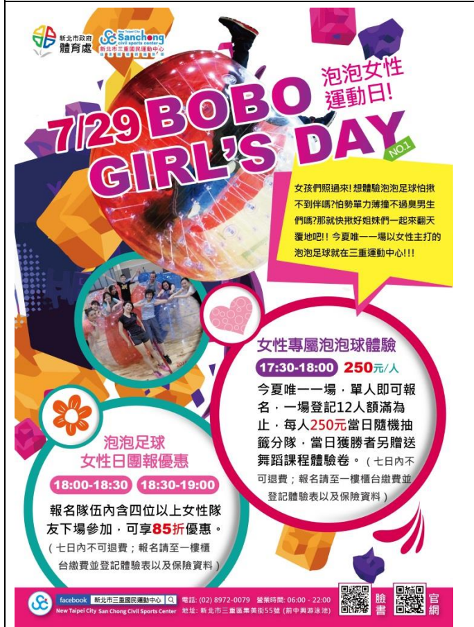
三重國民運動中心-女性泡泡日